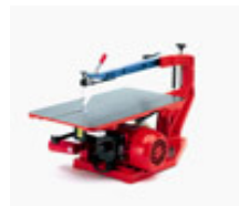
Hegner Multicut Quick