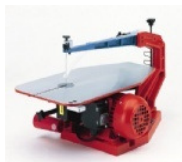
Hegner Multicut 1